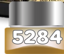
5284 BADEE AL OUD OUD FOR GLORY (UNISEX) de Lattafa edp spray 100 ml.