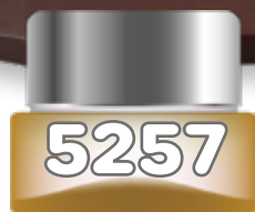
VINTAGE RADIO (UNISEX) de Lattafa edp spray 100 ml.