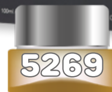
WINNERS TROPHY SILVER (UNISEX) de Lattafa edp spray 100 ml.