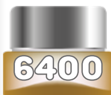
COLD (UNISEX) de United Colors of Benetton edt spray 100 ml.