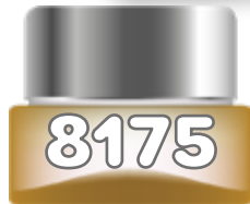
BE (UNISEX) de Calvin Klein edt spray 100 ml.