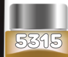
CHAMPAGNE BLACK (UNISEX) de Bharara Beauty edp spray 100 ml.